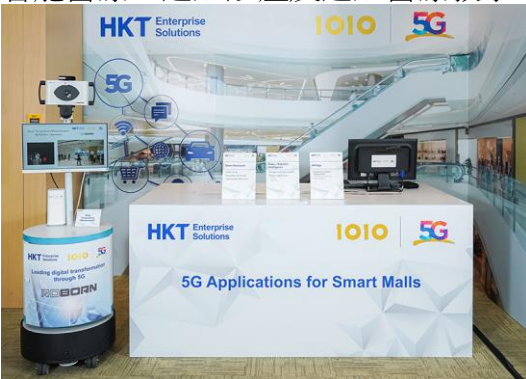
智能商場：5G 帶來全新客戶體驗