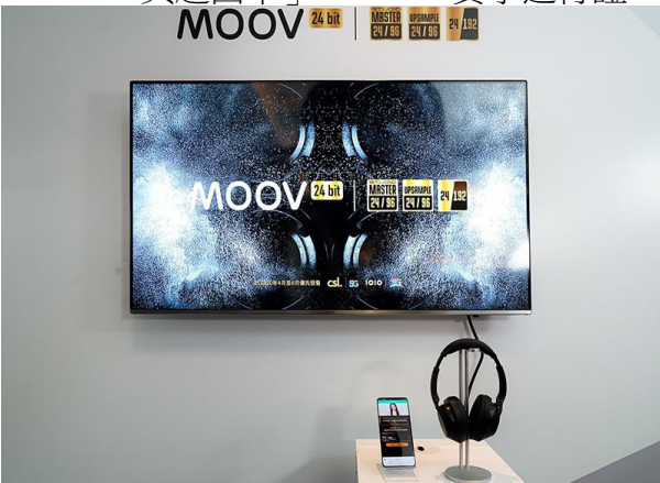
MOOV 24 bit 音樂服務