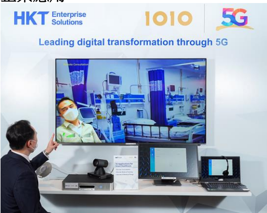
智能醫療：遙距診症及遙距醫療教學