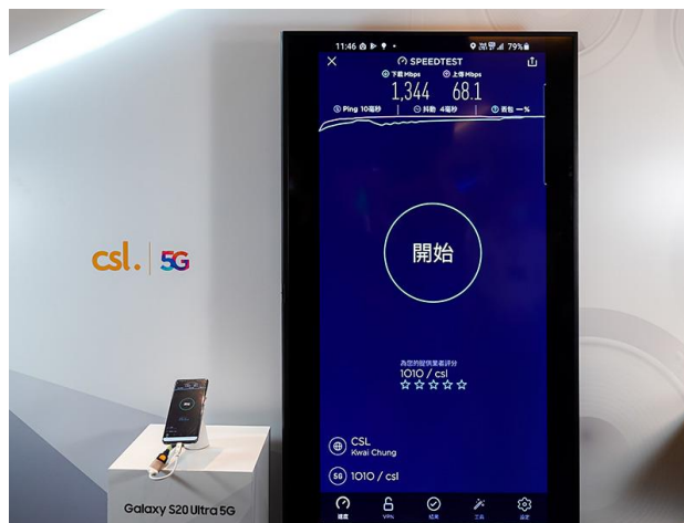
在 Samsung 5G 手機上進行網速測試