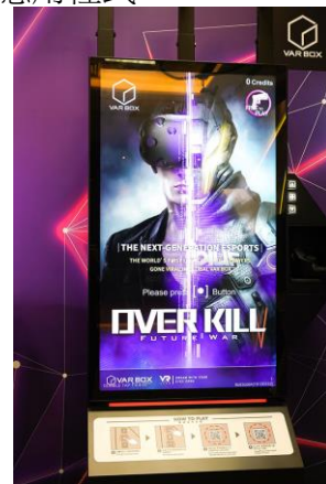
csl. VR 電競