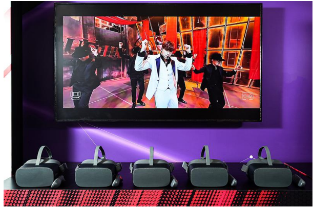
csl. 5G VR 應用程式