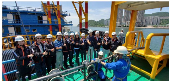
香港電訊工程部慶祝 UEL 竣工